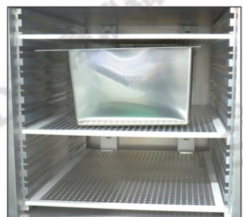
不锈钢处理腔体实拍图